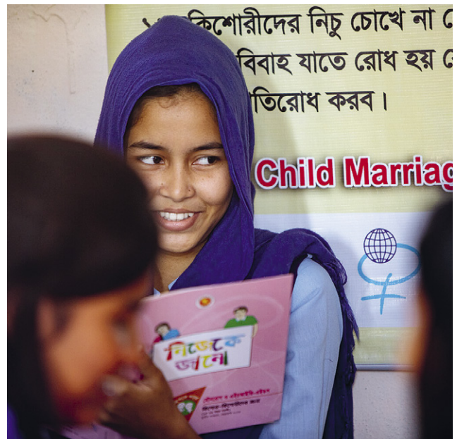
Ensemble contre les mariages d'enfants : En 2023, 3600 adolescent-es ont participé à des sessions de sensibilisation au Bangladesh.

Tous ces facteurs accroissent la vulnérabilité des filles et des femmes. Malgré tout, grâce aux efforts considérables de nos partenaires locaux ainsi qu'à divers ajustements budgétaires et de projet, nous avons pu poursuivre tous nos projets et promouvoir la santé et les droits des filles et des femmes, avec des résultats satisfaisants : le nombre de naissances dans les centres de santé que nous soutenons a augmenté pour atteindre 5700 (contre 3383 l'année précédente). 90 étudiantes sages-femmes ont pu suivre une formation grâce à nos bourses (contre 72 l'année précédente), et 225 sages-femmes ont bénéficié d'une formation continue (contre 34 l'année précédente). De plus, nous avons étendu notre action contre la violence basée sur le genre à la région Somali en Éthiopie et déjà remarqué des premiers changements. Pour nous, il est clair que nous devons faire tout notre possible pour soutenir les filles et les femmes dans les pays où nous intervenons. Notre vision reste celle d'un monde où tous les êtres humains peuvent vivre en bonne santé et en toute autonomie.